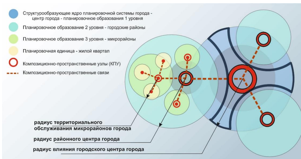
Рисунок 1 – Авторская концептуальная модель организации композиционно-планировочной системы городского образования [материал авторов]

На Рисунке 1 представлена графическая схема элементов городского пространства и их взаимосвязь.